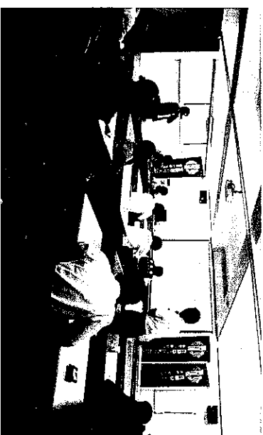
舉辦「議員評鑑公聽會」廣納各界建言。