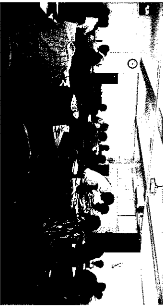
議員評鑑評審委員熱烈討論。

大法官許玉秀說得好：「透明是民主的顏色，透明是人權的盔甲，透明才能程序正當。」於今唯有依靠人民自我教育、自我覺醒，組成強大的公益團體，監督「公僕」，要求「透明」。須知「民主沒高枕無憂這等好事，一旦放棄對權力的監督控制，民主所剩的，不過是個空蕩蕩的虛名而已。」（作家朱天心語）