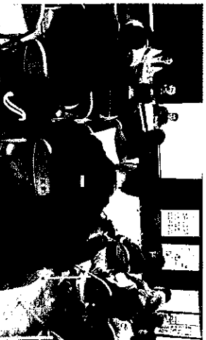
社區巡迴座談，宣揚「民主」理念，激發「公民」意識。

發揮民間中道力量，監督代議部門之間政等事項，以保障宜蘭縣民獲得正確資訊，並藉此宣導民主理念，發展公民社會，培植公共事務人才，謀取宜蘭縣民之公共利益。