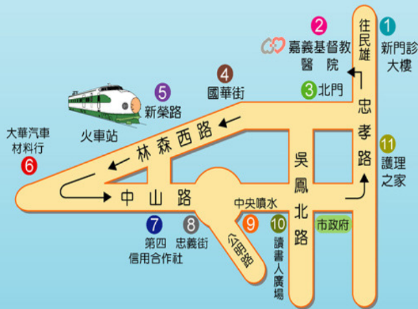
嘉義市區服務專車行駛路線圖