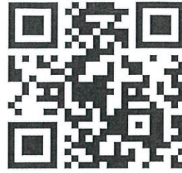
計畫專屬網頁連結