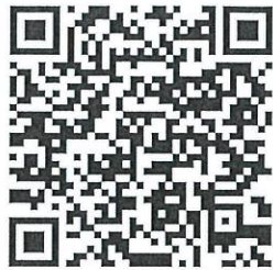
資格申請表下載連結