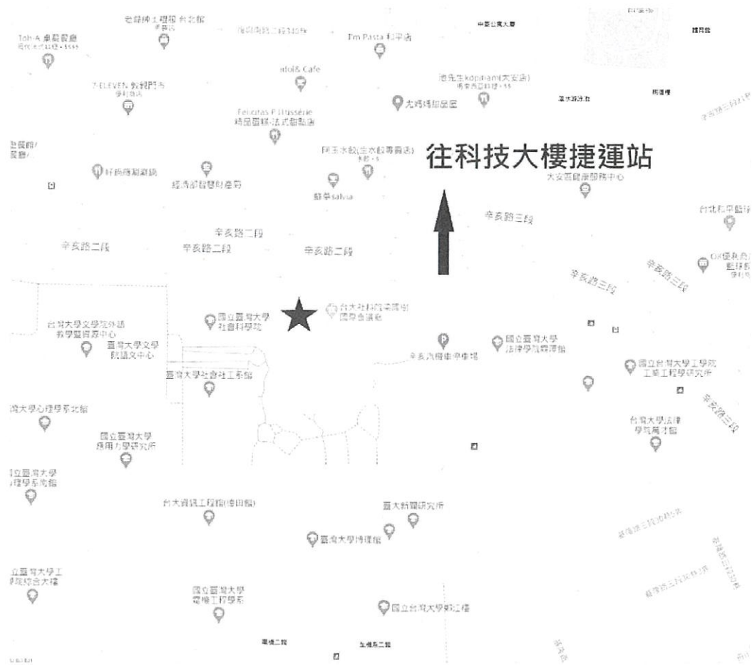
國立臺灣大學社會科學院位置示意圖