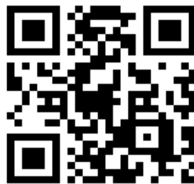
計畫專屬網頁連結

正 本：25 縣市藥師公會 副 本：「全民健康保險提升用藥品質之藥事照護計畫」各縣市公會聯絡人(共 24 位)、本會文存