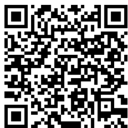
資格申請表下載連結