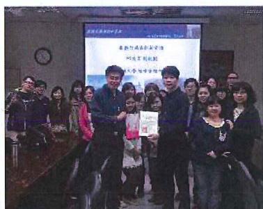
104級健康產業管理參訪