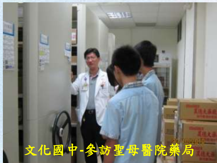
文化國中-參訪聖母醫院藥局