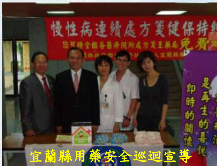
宜蘭縣用藥安全巡迴宣導