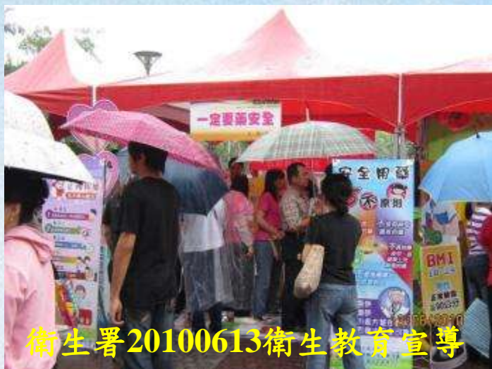
衛生署20100613衛生教育宣導