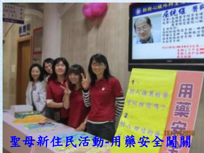
聖母新住民活動-用藥安全闖關