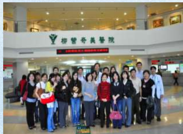
高雄仁武鄉華美社區