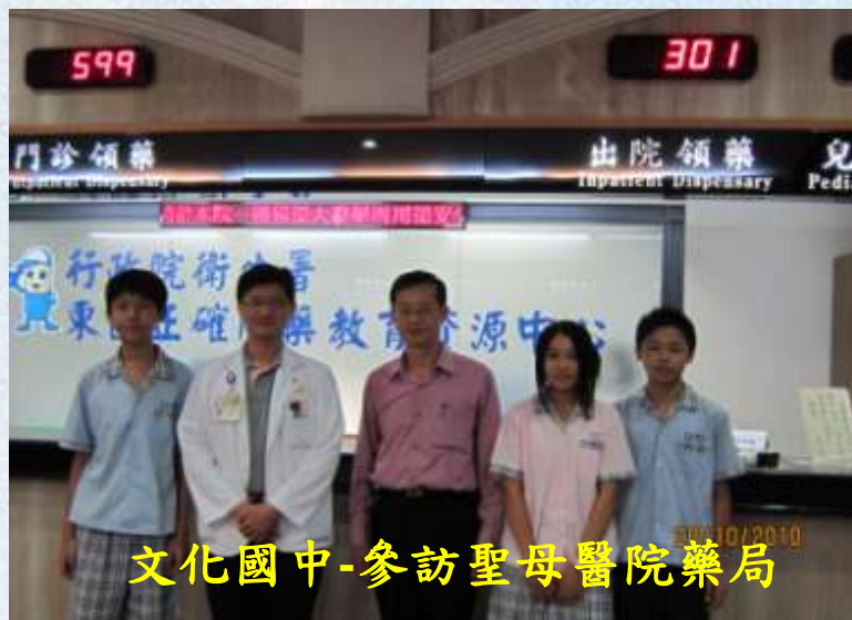
文化國中-參訪聖母醫院藥局