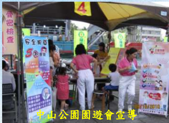
中山公園園遊會宣導